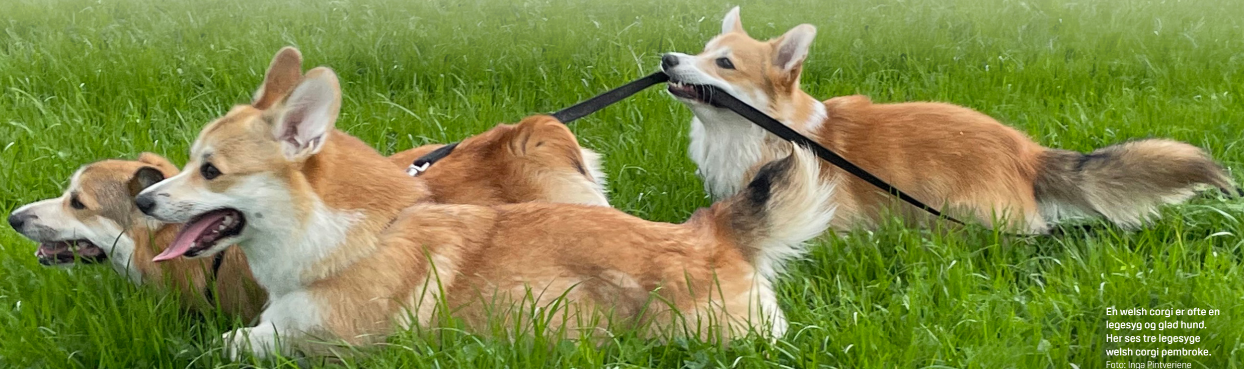
En welsh corgi er ofte en legesyg og glad hund. Her ses tre legesyge welsh corgi pembroke.