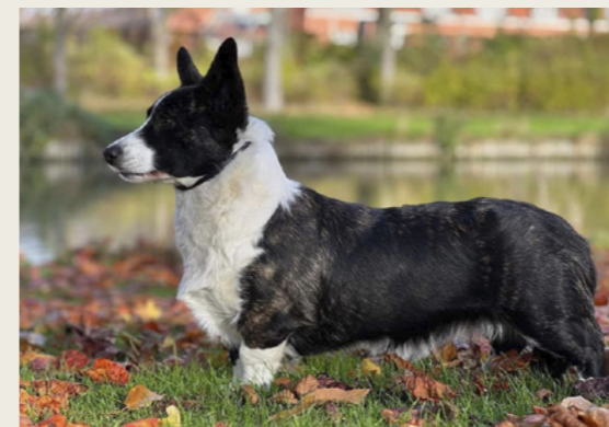
Welsh corgi cardigan.