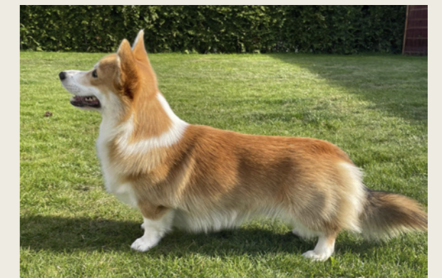
Welsh corgi pembroke.