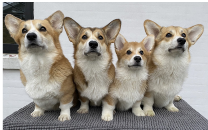
I 85 år havde den tidligere engelske Dronning Elizabeth welsh corgi pembroke, og racen er derfor ofte blevet omtalt som en kongelig eller royal hunderace.

Cardiganshire af misvækst og måtte derfor skifte fra kvæg til får, som ikke kunne klare nap i benene. Man krydsede derfor denne egns corgier med collier, og racen fik både et blødere sind og en anden farvevariation end den nære slægtning pembroke. Begge racer hører under Storbritannien, men var førhen en walisisk hund. Deres popularitet er steget markant de seneste årtier grundet deres milde og kærlige sind, deres trænbarehed og lette pelspleje.