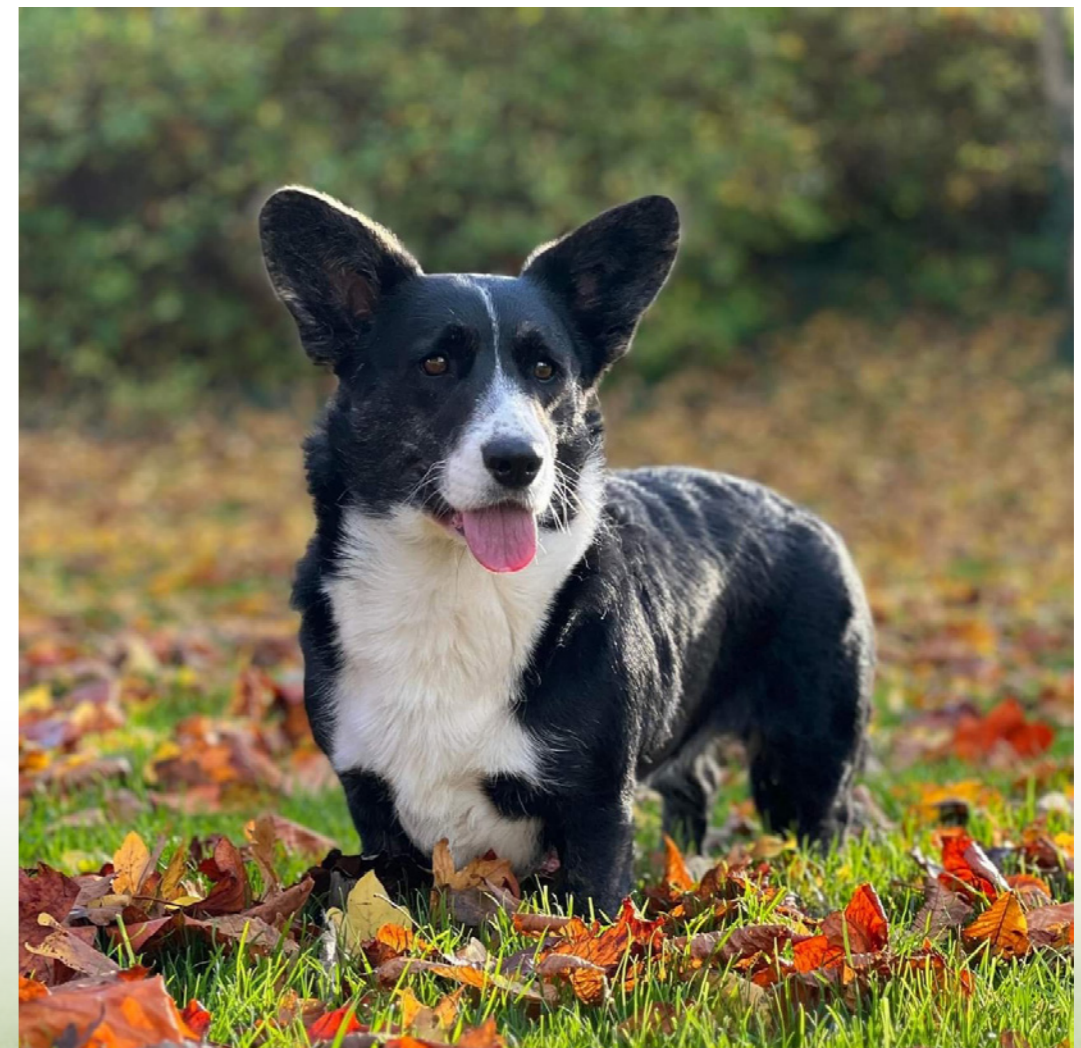
En welsh corgi cardigan er kendt for at være mere robust af bygning samt have længere hale og ben end den nærtbeslægtede pembroke.

Gennem adskillige århundreder har welsh corgi været en effektiv kvægdriver, som med sin ringe højde kunne undgå spark fra irriterede dyr. De to corgi-varianter blev tidligere betragtet som én race og blev derfor krydset med hinanden. I 1880'erne ramtes bjergbønderne i >