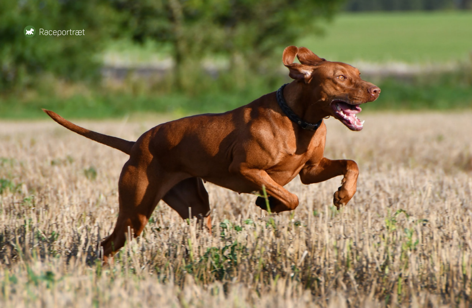
Vizslaen vil gerne ud at løbe stærkt. Den er en af de hunderacer, som kan opnå den højeste fart efter mynderne. Når den får dækket disse medfødte behov, er det en glad og nem hund at have.

der følger med det. Den vil også rigtig gerne følge med i, hvad familien laver og tage del i det. En velsocialiseret og veltrænet vizsla er nem at have med på tur. Vizslaen er meget venlig af natur og kan meget let lære at omgås andre husdyr. Flere har høns, kaniner og katte sammen med deres vizsla.