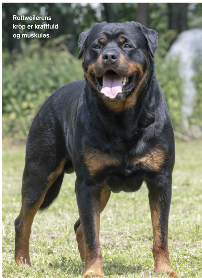
Rottweilerens krop er kraftfuld og muskuløs.

En rottweiler må ikke virke tung og kluntet, men skal være ædel i sin fremtoning og bevægelse.