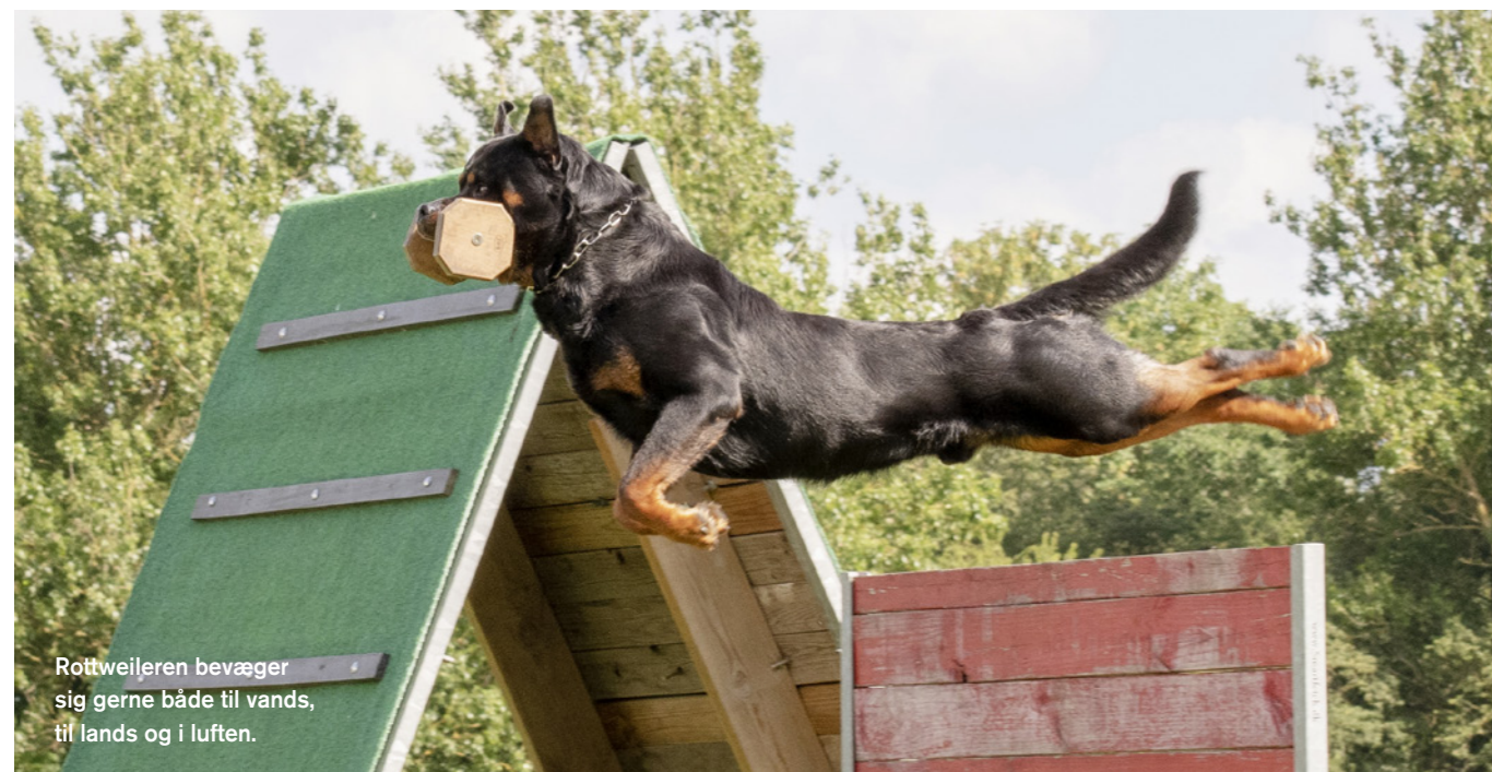
Rottweilern bevæger sig gerne både til vands, til lands og i luften.

Hundes adfærd er, uanset race, at den dominerende i flokken lader de underordnede komme til sig for at hilse. Den dominerende opsøger ikke. Hvis vi omsætter denne viden til vores hverdag, skal alle i flokken ignorere hunden, når vi kommer hjem. Virkeligheden er, at vi som det første hilser overstrømmende på hunden, og dermed gør vi den til flokkens overhoved. En rolle den selvfølgelig hverken kan eller skal udfylde. Så hvis hunden skal finde sig til rette med en rolle, hvor den ikke får ansvaret for flokken, er det altså vigtigt, at vi, de tobenede medlemmer i flokken, bruger den viden om adfærd, gør os selv til ledere og hunden til den nederste i hierarkiet og dermed fritager den fra opgaven med at beskytte og holde sammen. Dette tager et ansvar fra hunden, den alligevel ikke kan håndtere og giver den tid til leg og socialt samvær med os. Hvis vi ikke respekterer "reglerne" og ubevist gør hunden til leder, kan der ske det, at hunden kommer til at lide af separationsangst og bliver destruktiv, når den ikke kan holde flokken samlet. At have en rottweiler handler derfor meget om at respektere disse gener og have helt klare rollefordelinger i familien.