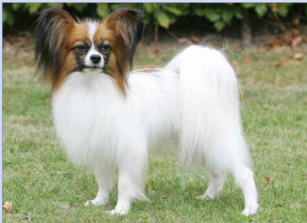
De seneste år har registreringstallet for papillonen ligget på lidt over 100.

Nærmeste stamfader til papillonen er racen phaléne. De to racer er identiske bortset fra et punkt, nemlig ørerne. Modsat papillonen har phaléne hængeører, hvoraf dens navn, som betyder natsværmer, er udledt. I dag er papillonen langt den mest udbredte af de to racer. Det sker ikke helt sjældent, at der dukker hund med rejste ører op i et kuld phaléne og omvendt. I