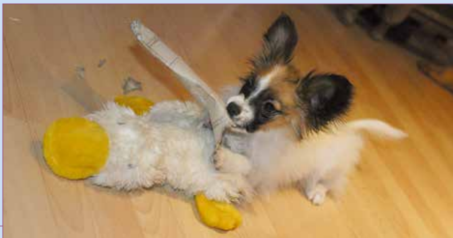
Papillonen er en legesyg hund fra fødsel til pensionsalder.