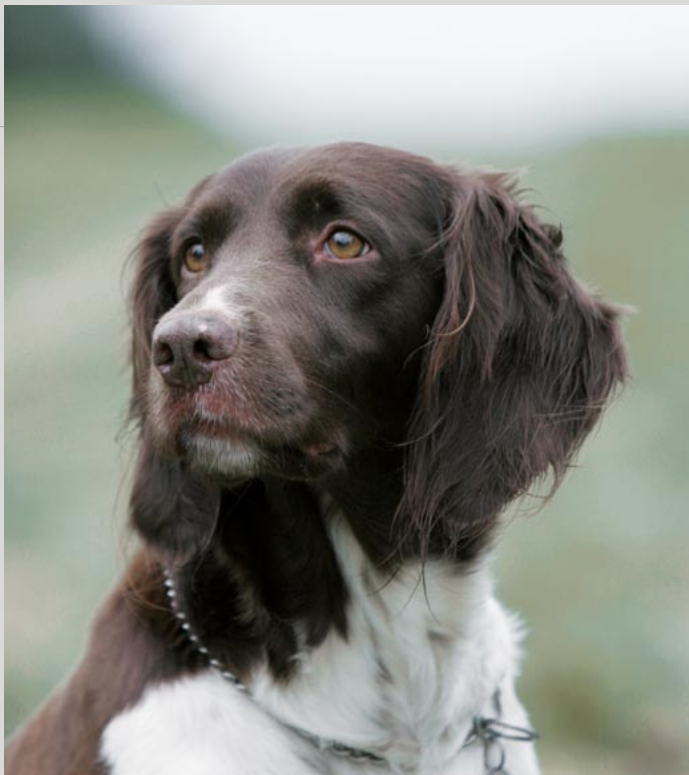
DKK's registreringstal for kleiner münsterländer 2005 var 236.