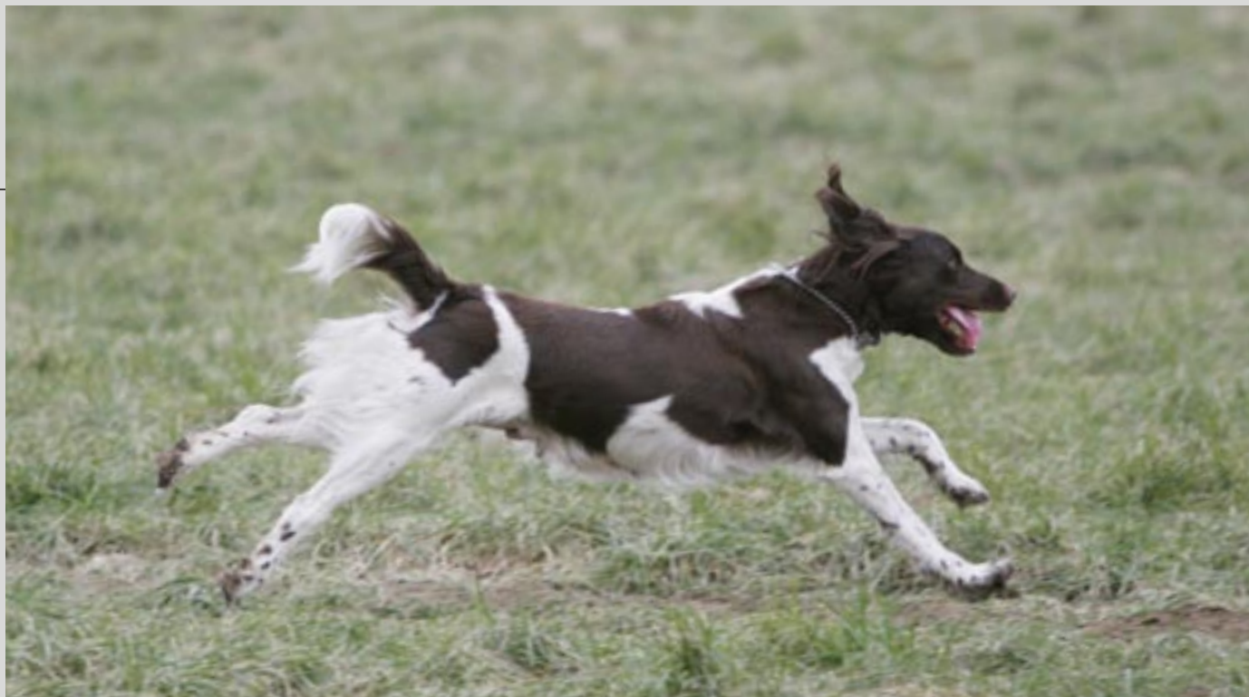
Kleiner münsterländeren er fantastisk udholdende og kan arbejde en hel dag i højt tempo, bare der er indlagt små pauser.

af racens alsidighed havde de stor gavn af den og brugte den til jagt på alt fuglevildt. Desuden havde de fundet en hund, der tog stand for harer, hvad der ikke er mange andre hunde, der gør.