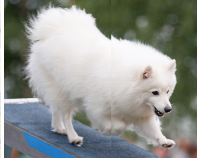
En japansk spids udstråler selvtillid og selvsikkerhed i sine bevægelser.