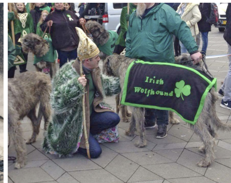
Sct. Patrick's Day fejres med grønne farver og irske ulvehunde i optog.