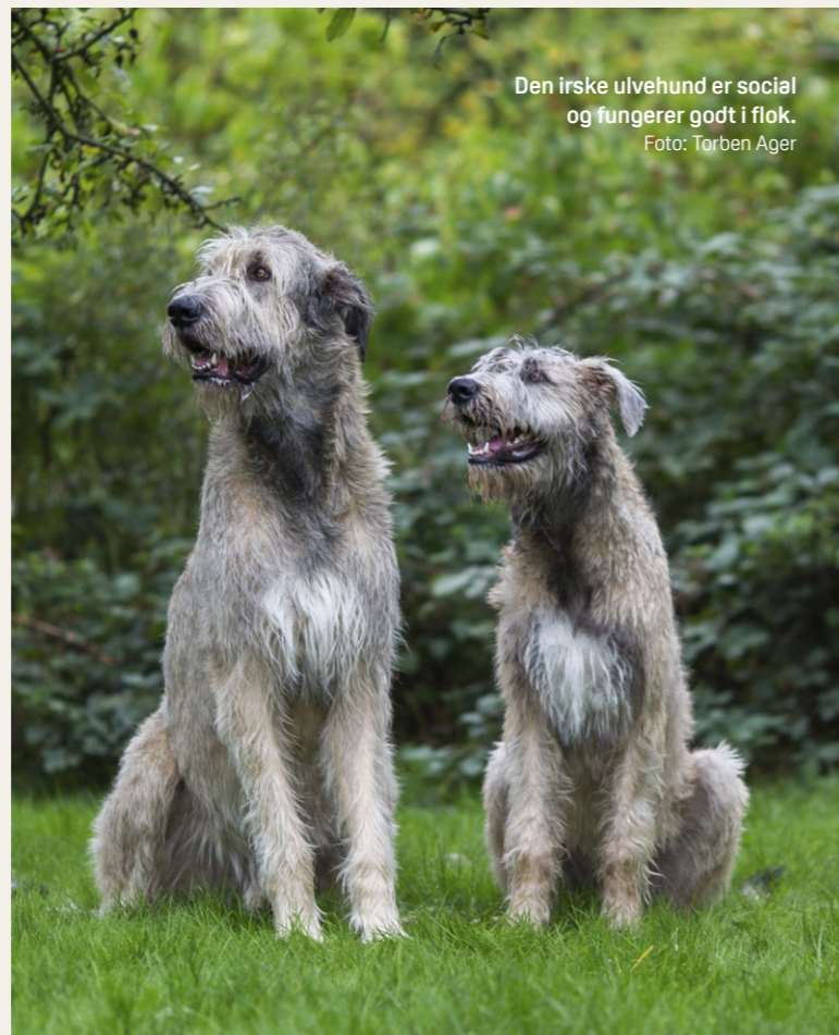
Den irske ulvehund er social og fungerer godt i flok.