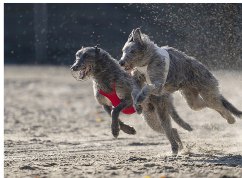
Sandet sprøjter, når de store mynder tester fart og smidighed.

VM i lure coursing i Tjekkiat.