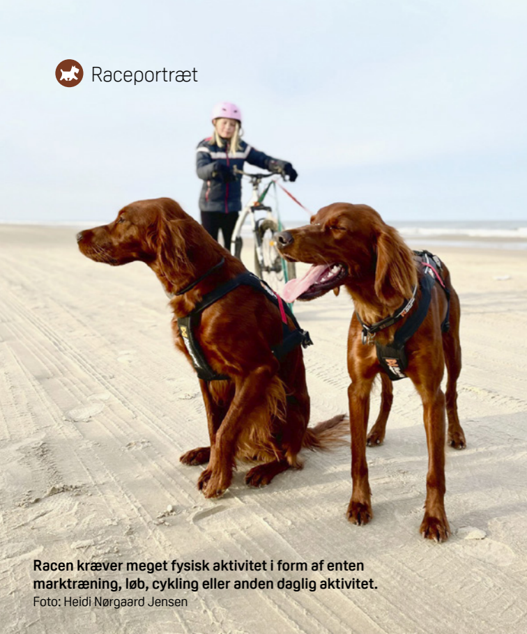
Racen kræver meget fysisk aktivitet i form af enten marktræning, løb, cykling eller anden daglig aktivitet.

både grundlæggende lydighed og specifikke jagttræningsøvelser. Socialisering fra en tidlig alder er også vigtigt for at sikre, at hunden udvikler sig til en velafbalanceret og selvstændig voksen hund.