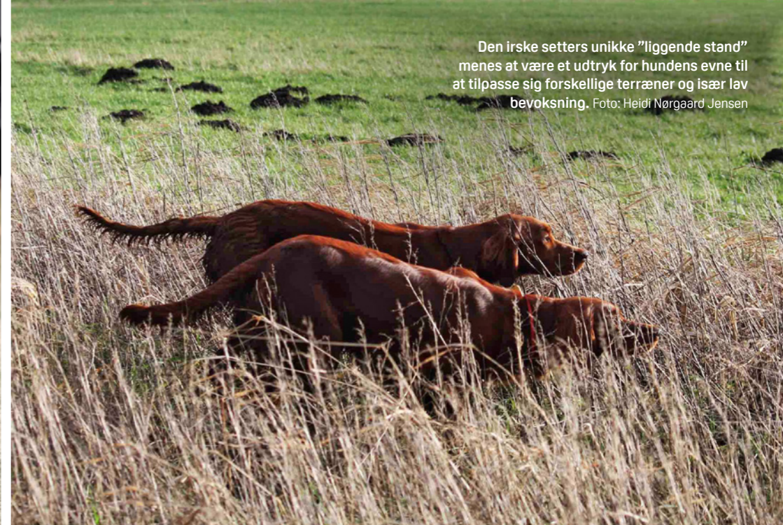
Den irske setters unikke "liggende stand" menes at være et udtryk for hundens evne til at tilpasse sig forskellige terræner og især lav bevoksning.

“Hunden kan på marken ses i høj fart og langstrakt galop, hvor man som fører af hunden nyder kontakten til hunden som en usynlig tråd mellem et fuldendt makkerpar”