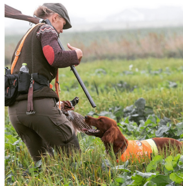
Jagt på markens agerhøns, fasaner og snepper hører til hundens primære færdigheder.

Når den irske setter har fået fært af vildtet, vil den stoppe sit løb enten meget pludseligt for at svinge sig rundt i retning af vildtet (kastestand) eller tage et par korte langsomme trin for derefter at stå stille og ikke bevæge sig videre frem. Derefter vil hunden blive stående og dukke, sænke eller lægge sig og pege snuden i retningen mod vildtet. Den irske setters unikke