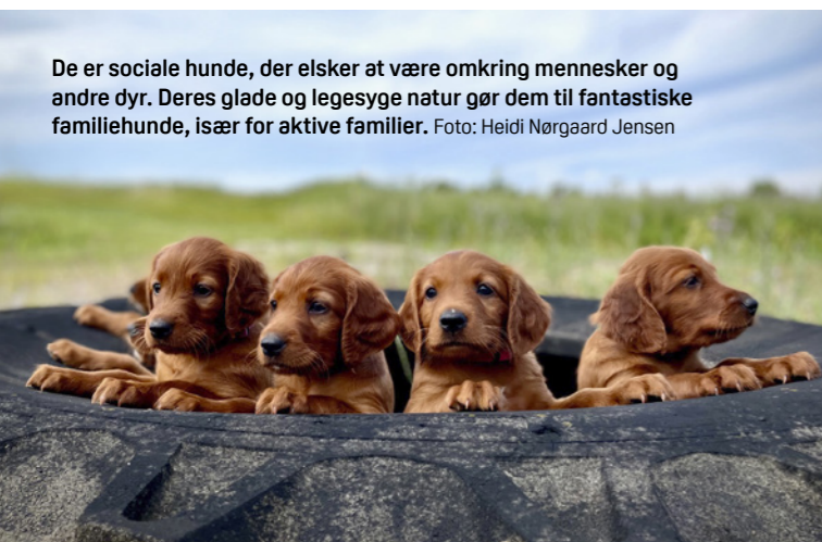
De er sociale hunde, der elsker at være omkring mennesker og andre dyr. Deres glade og legesyge natur gør dem til fantastiske familiehunde, især for aktive familier.