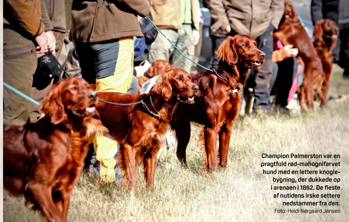
Champion Palmerston var en pragtfuld rød-mahognifarvet hund med en lettere knoglebygning, der dukkede op i arenaen i 1862. De fleste af nutidens irske settere nedstammer fra den.