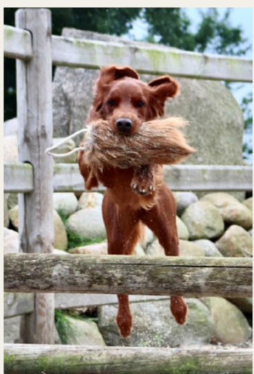
Apportering og lydighed er vigtige elementer i jagttræningen.