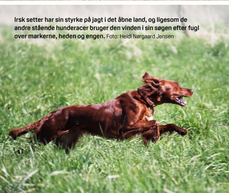
Irsk setter har sin styrke på jagt i det åbne land, og ligesom de andre stående hunderacer bruger den vinden i sin søgen efter fugl over markerne, heden og engen.

“Med den rette omhu og forståelse for hundens naturlige instinkter er der ingen grænser for, hvad man kan opleve og opnå på jagt eller markprøver med den arbejdsglade irske setter”