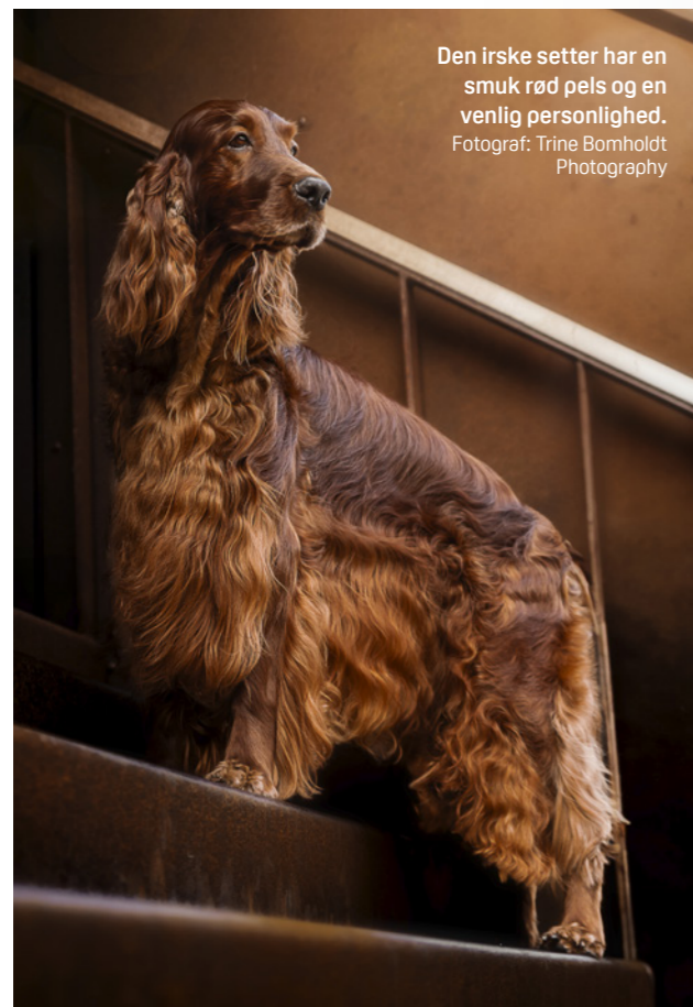
Den irske setter har en smuk rød pels og en venlig personlighed.

Den irske setter stammer fra Irland, hvor den er blevet opdrættet som jagthund siden det 18. århundrede. Hundene blev først brugt til jagt i det åbne irske højland på grouse, agerhøns, bekkasin og sneppe. Den irske setter kom til Danmark i midten af 1870'erne, og Dansk Irsk Setter Klub (dengang Dansk Rød Setter Klub) blev etableret i 1916. De første irske settere i Danmark blev importeret fra Tyskland, og senere hentede man også hunde med de bedste blodlinjer fra Sverige, Norge og England. Setternes anlæg for at finde, "sætte" og fastholde fuglen, for til sidst at drive den på vingerne og dermed i skudhøjde for jægeren, blev målrettede egenskaber i den videre avl af racen. Den irske setter er i dag udbredt til alle de nordiske lande, hvor de også bliver brugt til jagt på fasan, tjur, urfugl og rype. De første irske settere beskrives som rød-hvide. Senere har man fremavlet den klassisk udseende røde irske setter, som vi kender i dag.