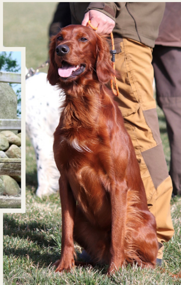
Racen er kendt for sin unikke rødgyldne pels og elegante udseende.