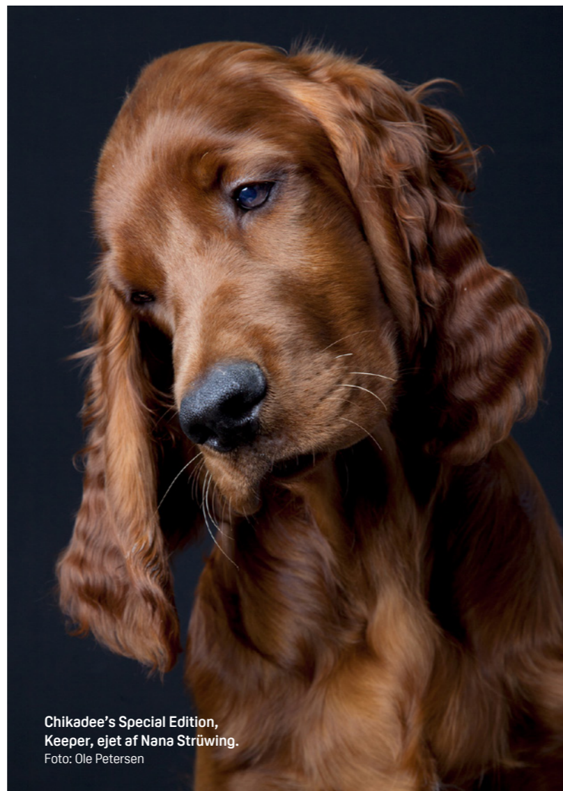
Chikadee's Special Edition, Keeper, ejet af Nana Strüwing.