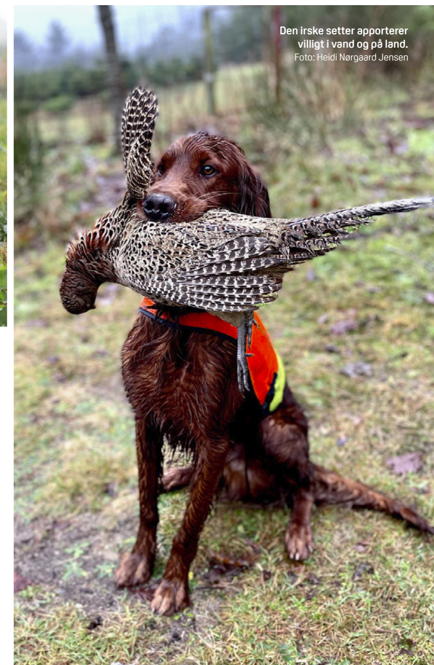
Den irske setter apporterer villigt i vand og på land.

Som en aktiv race kræver den irske setter daglig motion og mental stimulering. Lange gåture, løb, agilitytræning og apportering er alle fremragende aktiviteter som opfylder hundens behov. Træningen bør være konsekvent og inkludere >