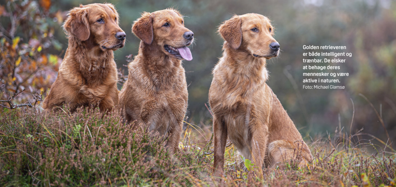
Golden retrieveren er både intelligent og trænbær. De elsker at behage deres mennesker og være aktive i naturen.

“Golden retrieveren er specielt glad for søge- og apporterende opgaver, da det ligger dybt i dens DNA”