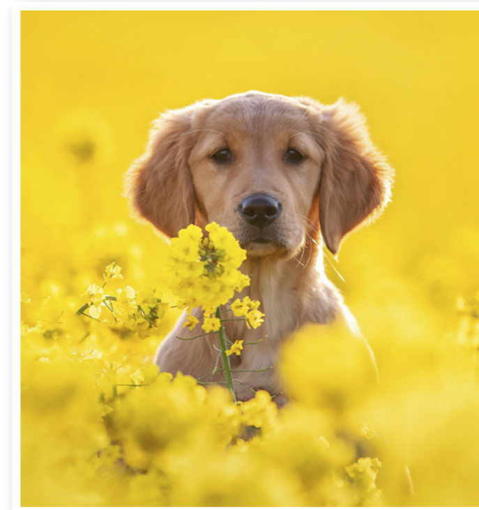
Specielt er golden retrieveren kendt for sit nuttede udseende og venlige sind.

Golden retrieveren har i mange år været øverst på danskernes liste over favorithunderacer. Det skyldes bl.a. dens søde udseende, milde sind og træningsvillighed. Racen fungerer både som hengiven familiehund og som en god makker på jagt