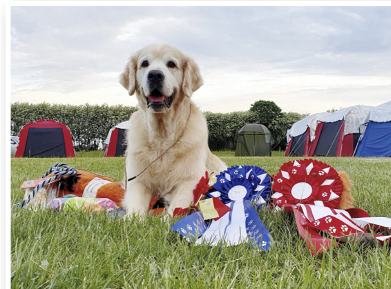
Laila Agers store stolthed, Boss in Motion de Ria Vela.