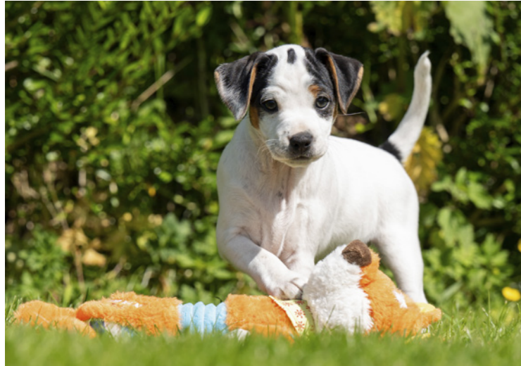
Kvik, harmonisk og fuld af energi.