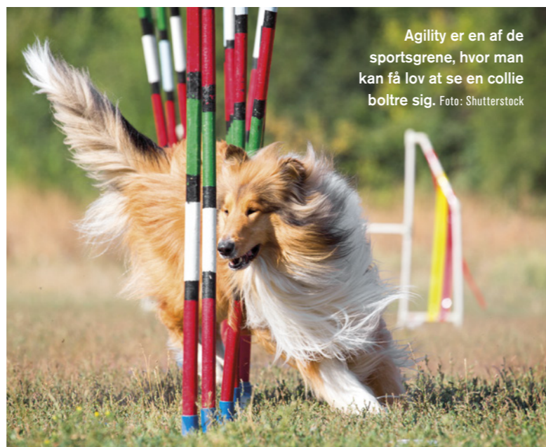
Agility er en af de sportsgrene, hvor man kan få lov at se en collie boltre sig.

Der er lige i disse år en spirende tendens til også at træne brugsarbejde her i Danmark med sin collie. Som noget relativt nyt ser man flere collier tage en færdselsprøve, og flere fortsætter med at træne spor/