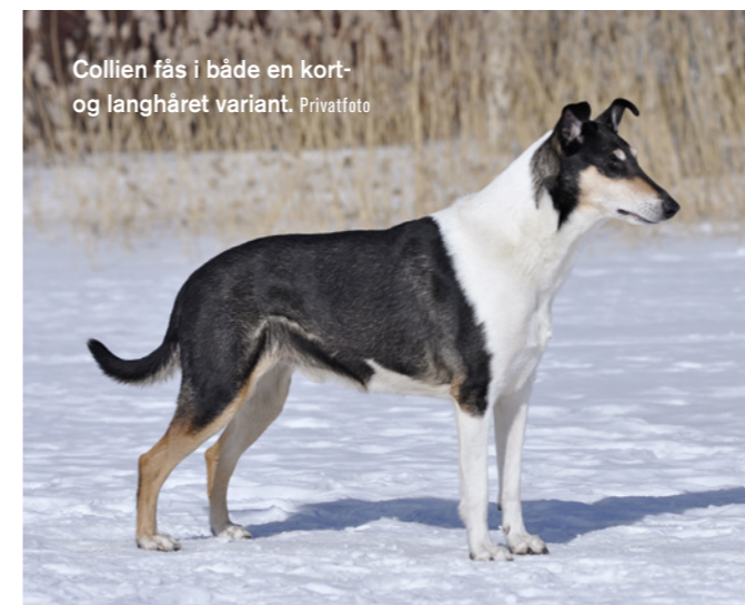
Collien fås i både en kort- og langhåret variant.

Collie har været stavet på forskellige måder i forskellige perioder. Col betyder simpelthen sort på angelsaksisk, hvilket har ført til teorier om, at racen er opkaldt efter de sort-hovede får, som var de mest almindelige i Skotland på den tid.