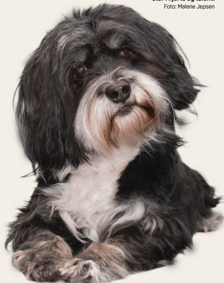
Lille af størrelse, men stor i hjerte og talent.

Den 28. november 2018 fødtes en lille tricolor-farvet bichon havanais, som fik navnet Tesla. Hendes fulde navn er Small Opals That's Amore, og hun er opdrættet af Helle Bekker. De første syv måneder af sit liv tilbragte Tesla hos Helle, hvor hun blev udstillet og lærte at blive børstet og vasket. Derefter flyttede hun til mig som udstationeringshund lige før tiden med covid-19, og den første tid brugte vi på at lære hinanden at kende. Tesla skulle egent-