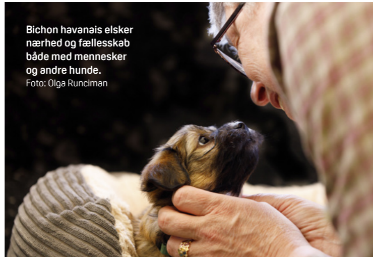
Bichon havanais elsker nærhed og fællesskab både med mennesker og andre hunde.

empati evner den nogle gange næsten for godt at kunne optage dens yndlingsmenneskers følelser, uro og usikkerhed. Det er derfor igen vigtigt at se den som en hund, der som arten HUND stadig har behov for at blive guidet, passet på og rammesat. Selvom den ikke er angstfuld, er den en følsom hund, som reagerer på at få sine grænser overskredet. Den kan have svært ved fri leg i hundeskove, da dens lille størrelse gør den sårbar over for større hunde, og den foretrækker at lege med sin egen race og trives godt med ligesindede. Som børneven er racen en oplagt familiehund, men det er vigtigt, at børn lærer at respektere dens grænser og forstå dens skrøbelighed på grund af dens størrelse. Havaneseren er dog meget opsøgende overfor børn, da den elsker sjov og leg.