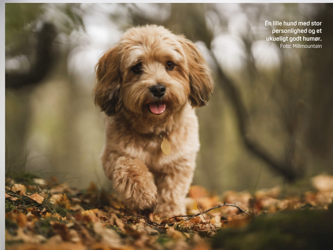
En lille hund med stor personlighed og et ukueligt godt humør.

D er er både intelligens, charme, finurlige spilopper, kærlig empati og et ukueligt godt humør gemt i dens lille, smukke, pelsede krop, og dens størrelse gør tillige, at den er utrolig praktisk at have med at gøre. En bichon havanais er nem at have med rundt omkring hos venner og familie, med på arbejde og ud på rejser, og så er den særdeles velegnet til at bo med i byen. Går du en tur rundt i hovedstaden, vil du da også bemærke, at der især her er utrolig mange eksemplarer af racen, som går rundt i alskens farver og charmerer de forbipasserende.