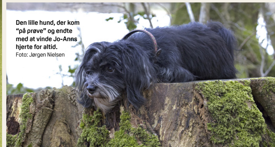
Den lille hund, der kom "på prøve" og endte med at vinde Jo-Anns hjerte for altid.

I dag træner Tesla mest til DKK's lydighedsprøver, hvor hun har bestået klasse 1 (LP1) intet mindre end 15 gange, hvorefter hun rykkede i klasse 2, som hun bestod som den første af sin race. Hun går stadig lidt klasse 2, mens hun sideløbende træner til klasse 3, hvor vi først vil gå efter titlen LP3 og så den helt store drøm om dansk lydighedschampion. Tesla har også deltaget i Hoopers og opnået præmiering der. Noget andet, vi har deltaget i, er hverdagslydighedstræning (HLT), hvor der er fire niveauer; bronze, sølv, guld og elite. Når man består guld tre gange, bliver man dansk hverdagslydighedschampion (DKHLTCH), hvilket Tesla har opnået. Nu går hun i eliteklasse, hvor hun fik et point for lidt i første forsøg til at bestå.