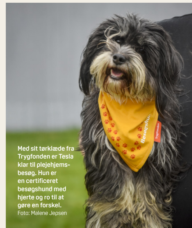
Med sit tørklæde fra Trygfonden er Tesla klar til plejehjemsbesøg. Hun er en certificeret besøghund med hjerte og ro til at gøre en forskel.

lig bare "på prøve", da jeg ikke var sikker på, at jeg kunne holde af en lille hund. Jeg har tidligere opdrættet rhodesian ridgebacks, og jeg har haft otte af dem over nogle år. Tesla og jeg har fået et helt særligt bånd, og vi er meget knyttede til hinanden, hvilket også gør, at Tesla næsten er umulig for andre at passe, da hun "græder", når hendes mor er væk. Det går rimeligt, hvis f.eks. mine forældre passer hende hjemme hos mig, men ellers er hun et vrøvlhoved, indtil hendes mor kommer hjem igen. Tesla er helt sikkert "kommet på højde med" de ridgebacks, jeg har haft, selvom det er en helt anden måde at have hund på.