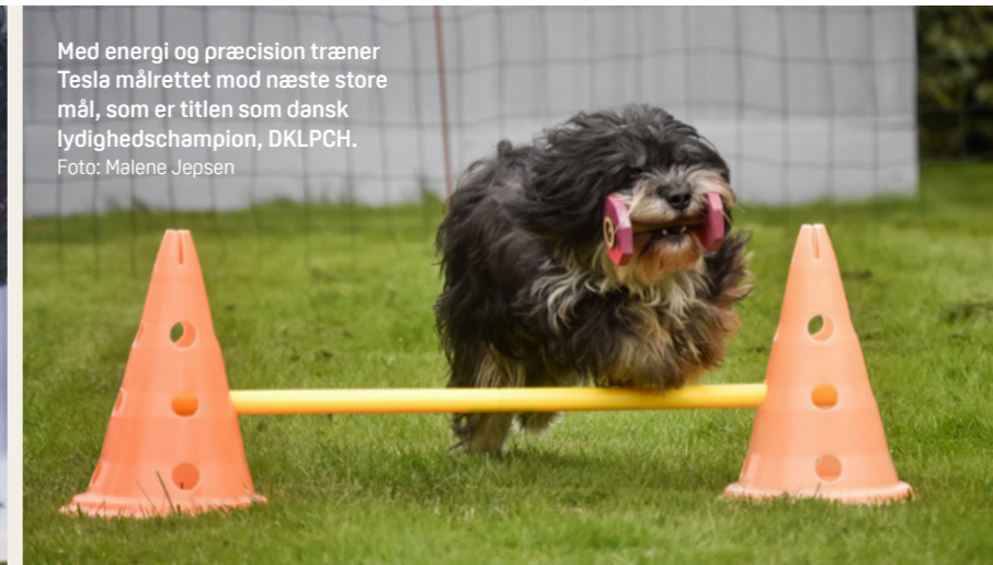
Med energi og præcision træner Tesla målrettet mod næste store mål, som er titlen som dansk lydighedschampion, DKLPCH.