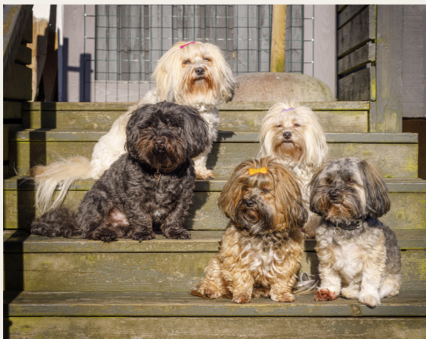
Den smukke pels kræver omhyggelig pleje, men til gengæld fælder den minimalt og kommer i et væld af farver, der kan ændre sig gennem livet.

Selv klippet pels kræver vedligeholdelse, da en tæt struktur kan gemme på filtre, som kan være svære at fjerne. Mange vælger at få pelsen ordnet af en professionel, men det kræver både tid og penge. Heldigvis oplever ejere af bichon havanais ikke de samme fældeperioder som andre hunde, hvilket gør dem attraktive for allergikere, selvom det ikke er en garanti.