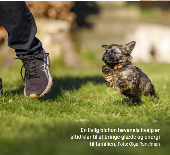
En livlig bichon havanais hvalp er altid klar til at bringe glæde og energi til familien.

Bichon havanais er en trofast og følsom hund, der knytter sig tæt til sin familie og trives med trygge rammer, kærlig guidning og masser af nærhed.