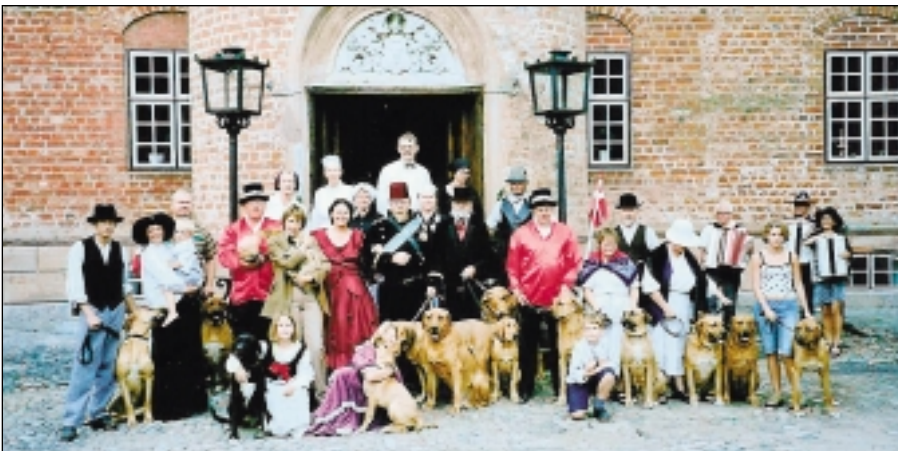
Nu er der atter broholmere på Broholm, idet slottets nuværende ejere har flere eksemplarer af racen. Den 23. august fyldes slottet med broholmere ved Broholmerselskabets årlige skue, hvor der også udstilles forskellige broholmergenstande. Billedet stammer fra et tidligere arrangement på Broholm, hvor også "Frederik de 7." og "Grevinde Danner" medvirkede.

- Kort sagt vil jeg mene, at broholmeren kan tilfredsstille ethvert behov, man måtte have som hundeejer. Men inden man anskaffer sig en, skal man bare gøre sig klart, at den kræver en del plads, for den skal have mulighed for at bevæge sig, selv om den ikke har behov for specielt megen motion. Og så bliver mange overrasket over, hvor meget en broholmer spiser. Den er dyr i foder. Til gengæld er det en sund og robust hund, der kræver et minimum af pelspleje. ■