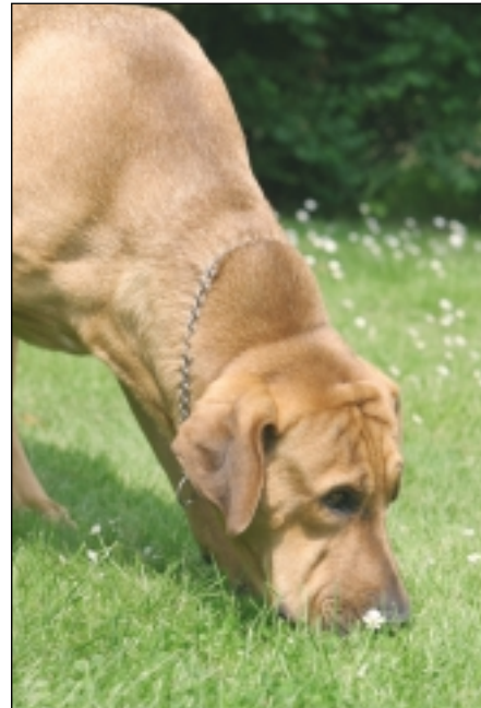
Broholmeren er ganske god til næsearbejde.

- Fra naturen er broholmeren en venlig og selvsikker hund. Samtidig med at det er en elskelig familiehund, giver den tryk i kraft af sin vagtsomhed. Den udøver sin magt gennem stemmen, og på grund