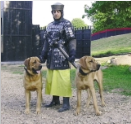
Broholmeren har virket på de skrå brædder i flere sammenhænge. Her ses to af slagsen fra Det Kongelige Teaters opsætning af Ivanhoe i Dyrehaven denne sommer.

- Broholmeren er stærk som en okse, og jeg har haft stor succes med at spænde den for børnenes vogn og slæde.