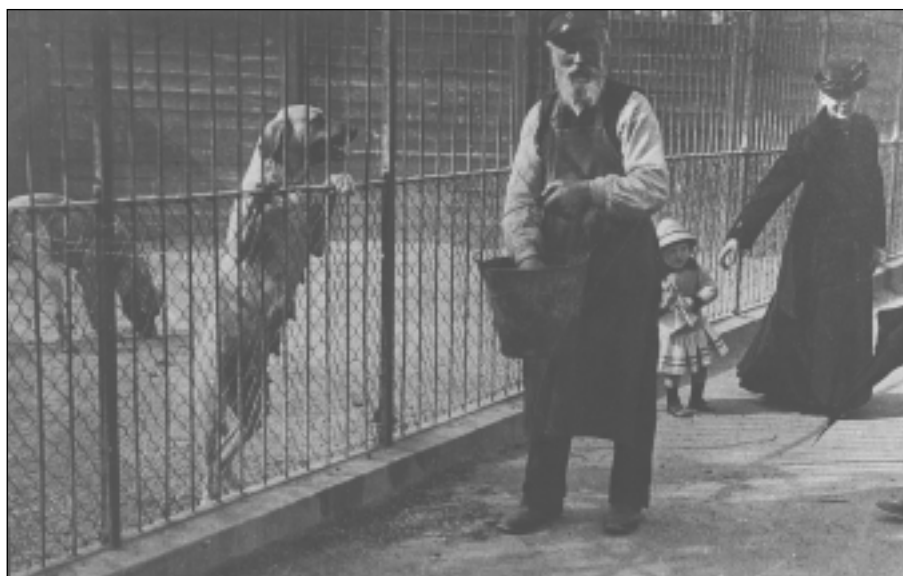
Frem til omkring år 1900 havde zoologisk have i København broholmere.

- Standarden blev anerkendt af FCI (DKK's moderorganisation) i 1982. I dag findes der ca. 550 broholmere - de fleste naturligvis i Danmark, men ni øvrige lande kan bryste sig over at have et par eksemplarer hver. De udenlandske broholmerejere har deres hunde på samme præmisser som de danske med hensyn til avl. ➔