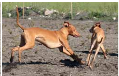
Masser af motion, masser af leg og gerne noget jagtrelateret beskæftigelse er vigtigt for pharaoh houndens trivsel.